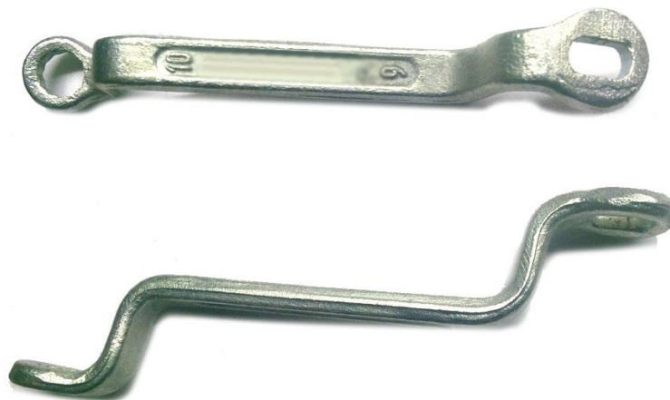
Рис. 1. Ключ А.57070 для удерживания штока амортизатора при отвертывании гайки крепления